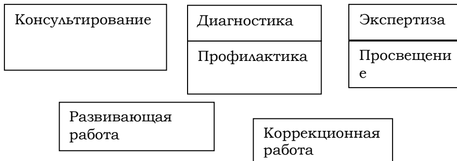
Рис. 1 Основные формы психолого-педагогического сопровождения

В процессе реализации основной образовательной программы используются такие формы психолого-педагогического сопровождения, как: